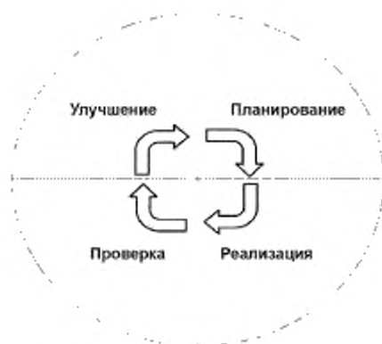
Рисунок 4 — Цикл управления ПСЦ

Управление ПСЦ осуществляется в соответствии с циклом PDCA (см. рисунок 4), включающий в себя следующие этапы: