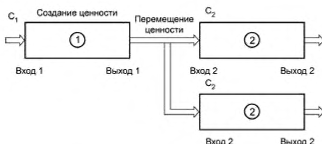
Рисунок 3 — Структура элементарного действия по созданию и перемещению ценности (последовательно-параллельные цепи)